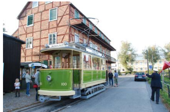
MSS 100, byggd av Kockums 1906, vänder i Banérs kajen

vid senaste höstmötet att med tacksamhet acceptera inbjudan från Museispårvägen i Malmö att hålla vårmötet i Malmö på tekniska museet.