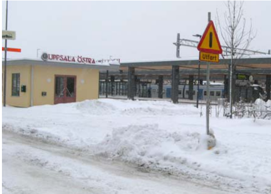
Vinterbild från 23 december, foto Johan Vinberg.

Jag sitter just nu på eftermiddagen den 23:e, med min laptop på Uppsala Östras Bx och skådar ut mot SLs pendeltåg, SJs Uppsalapendel och en mängd övriga förbipasserande tågsätt med olika operatörer som huvudmän. Man är lite privilegierad som aktiv på ULJ eftersom man då får tillgång till lokalerna på Uö med tillhörande skådespel utanför fönstren.