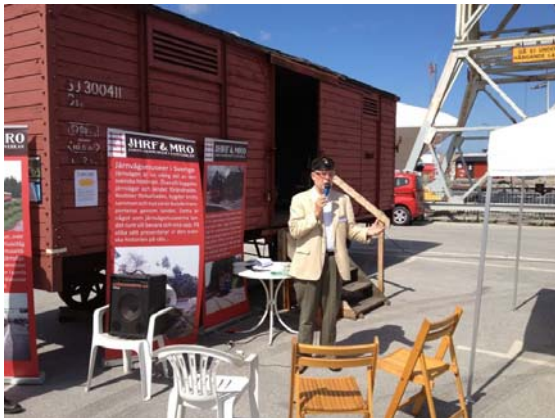
Björn von Sydow i aktion utanför godsvagnen

Det andra seminariet hölls på onsdagen vid vår vagn. Temat var Levande järnvägmuseer – har Sverige råd att ha dem kvar? Huvudtalare här var förre talmannen Björn von Sydow.