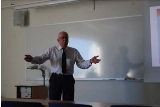
MRO:s ordförande i full action på måndagsmorgonen

Det andra seminariet hölls på onsdagen vid vår vagn. Temat var Levande järnvägmuseer – har Sverige råd att ha dem kvar? Huvudtalare här var förre talmannen Björn von Sydow.